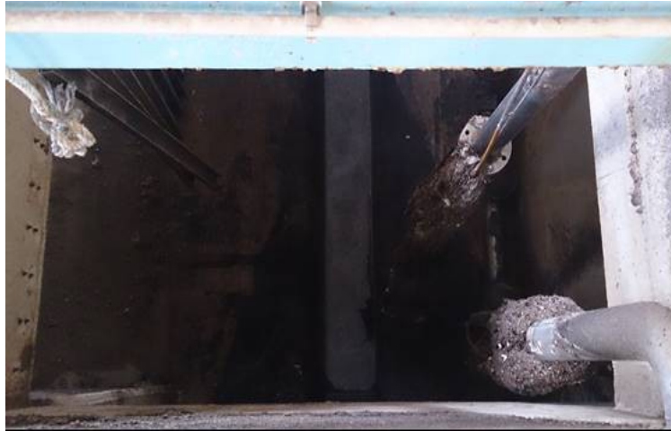
Desarenador en la depuradora de Santa Ponsa