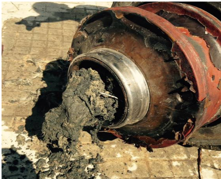
Obturbación y desgaste en bomba sumergible de aguas residuales