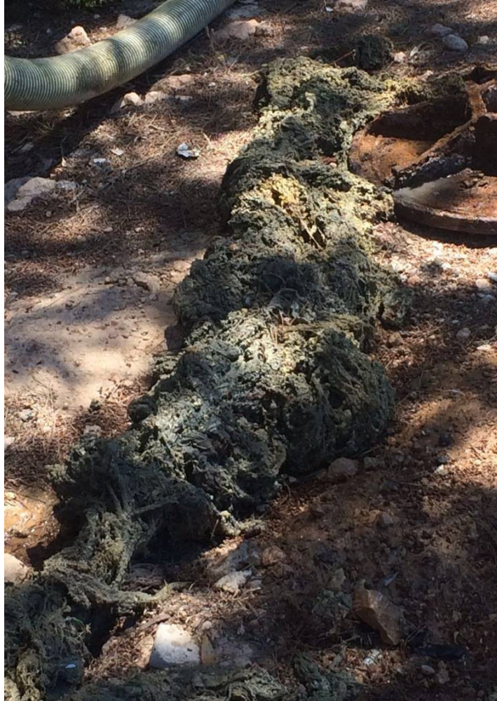
Residuos extraídos de limpieza en red de alcantarillado